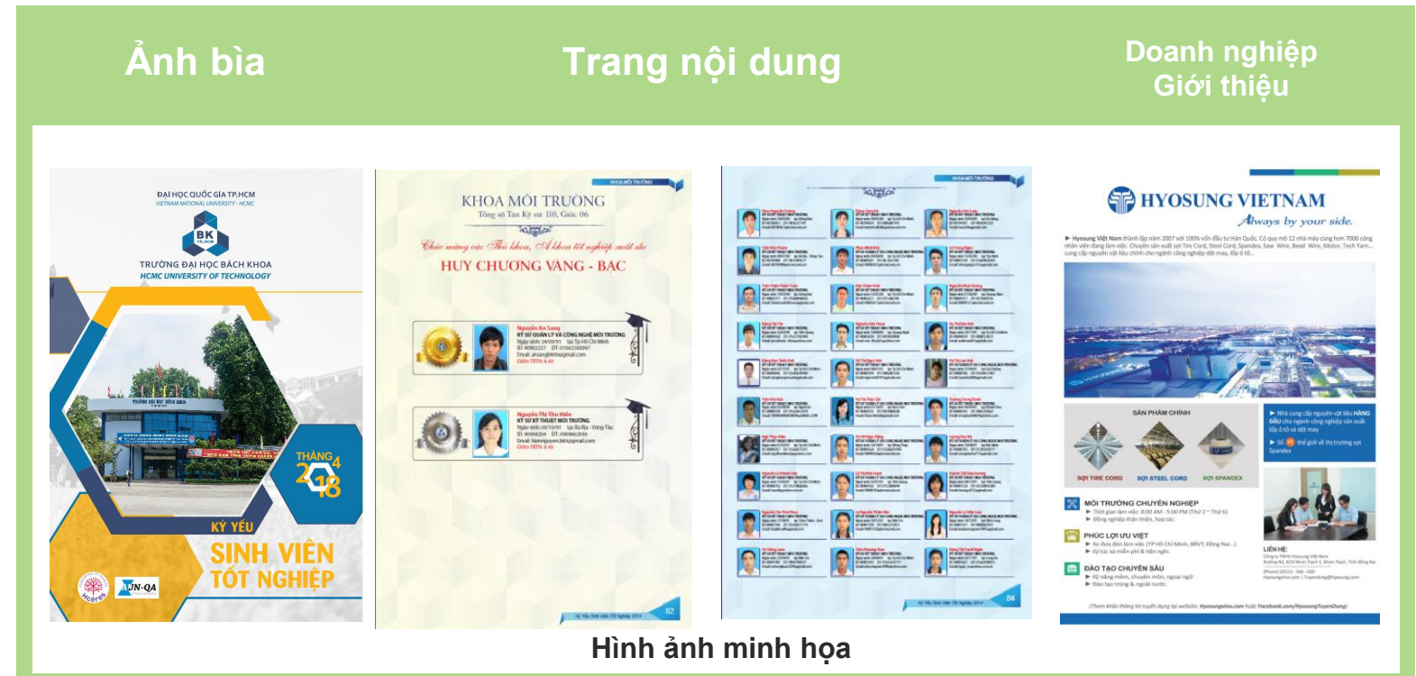
Hình ảnh minh họa